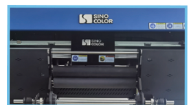
高温胶辊覆膜一体